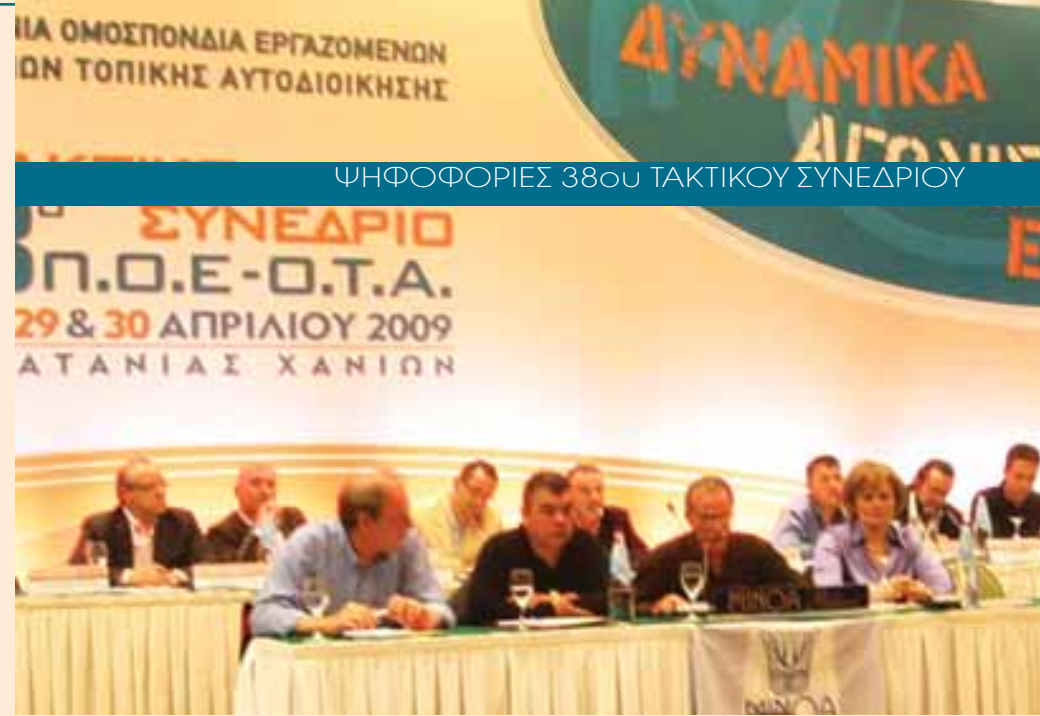
ΨΗΦΟΦΟΡΙΕΣ 38ου ΤΑΚΤΙΚΟΥ ΣΥΝΕΔΡΙΟΥ